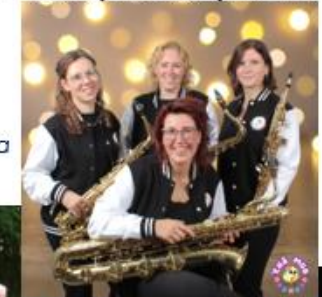
Saxofoonkwartet Ehā Mōa

Deze keer met een wel hele bijzondere line-up! De Amerikaanse fanfare zal samen met haar muzikale gasten zorgen voor een afwisselend programma met een mix van diverse muziekstijlen. Samen met u willen wij proosten op een nieuw jaar, een jaar met nieuwe muzikale hoogtepunten.